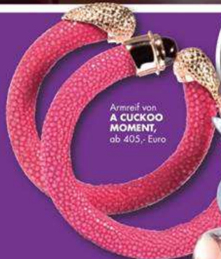
Armband von A CUCKOO MOMENT , ab 405,- Euro