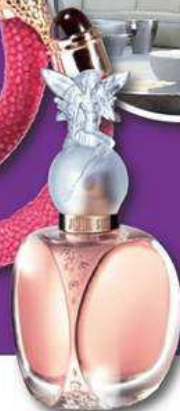
Fairy Dance Duet Anna Sui , 50 ml für 39,95 Euro