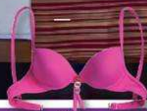
Bikini von Palmer's , 82,90 Euro