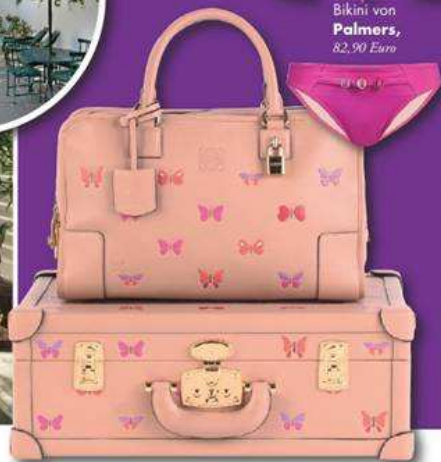
Tasche und Koffer von Loewe Madrid , um 4.000 Euro